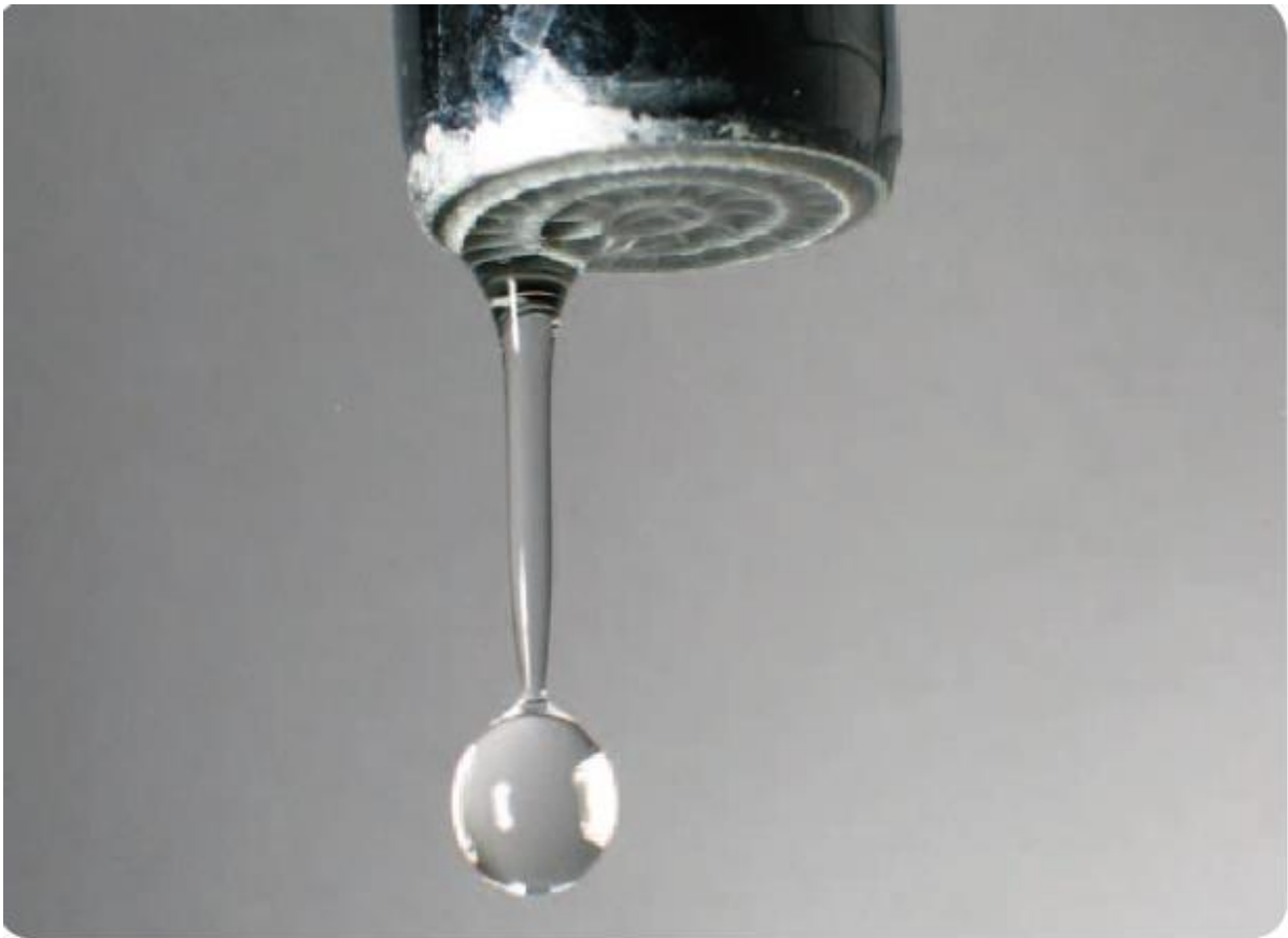
Image extraite de l' « Activité 3 » de la Malette pédagogique « Logement » de Lire & Écrire asbl