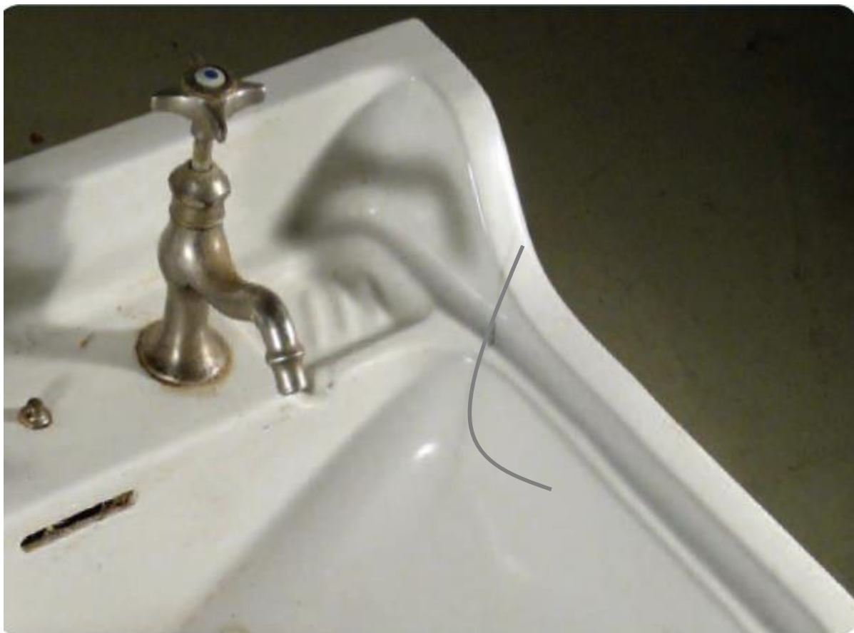
Image extraite de l' « Activité 3 » de la Malette pédagogique « Logement » de Lire & Écrire asbl