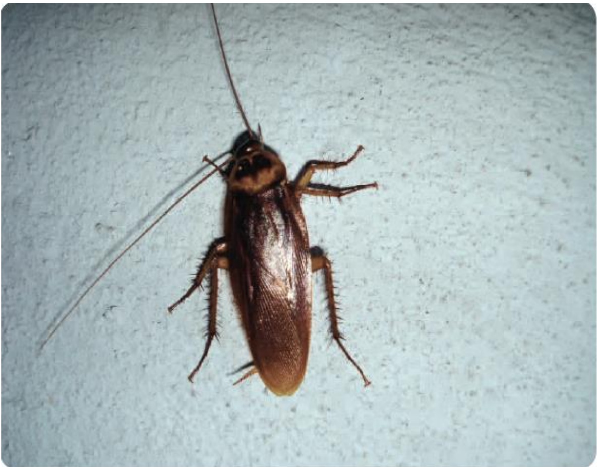
Image extraite de l' « Activité 3 » de la Malette pédagogique « Logement » de Lire & Écrire asbl