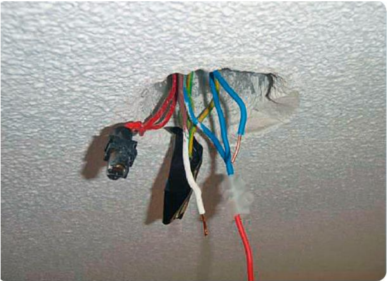
Image extraite de l' « Activité 3 » de la Malette pédagogique « Logement » de Lire & Écrire asbl