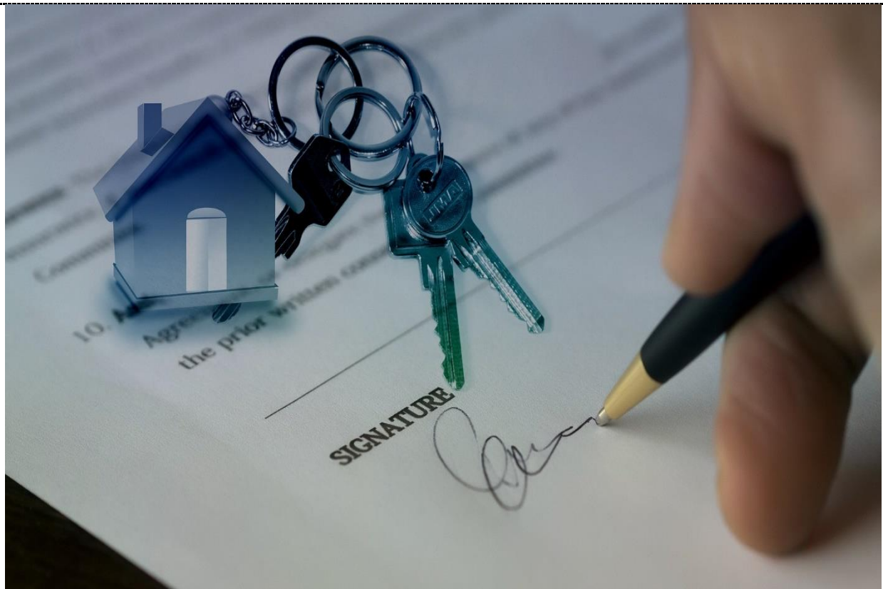
Signer un contrat de bail