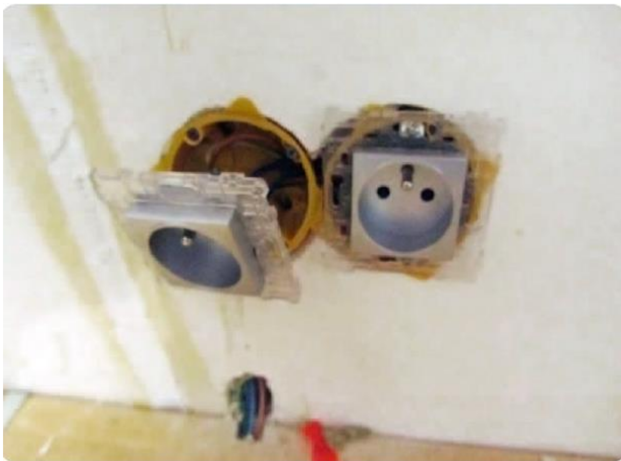
Image extraite de l' « Activité 3 » de la Malette pédagogique « Logement » de Lire & Écrire asbl