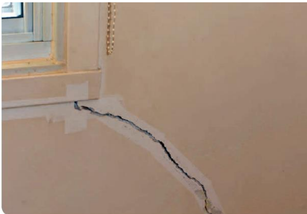
Image extraite de l' « Activité 3 » de la Malette pédagogique « Logement » de Lire & Écrire asbl