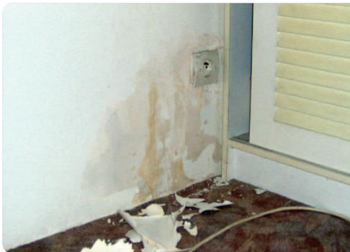
Image extraite de l' « Activité 3 » de la Malette pédagogique « Logement » de Lire & Écrire asbl