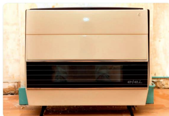
Images extraites de l' « Activité 3 » de la Malette pédagogique « Logement » de Lire & Écrire asbl