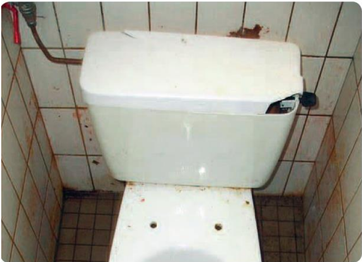
Image extraite de l' « Activité 3 » de la Malette pédagogique « Logement » de Lire & Écrire asbl